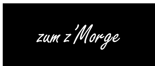
Texttafeln unterstützen und ergänzen die Bildbotschaft (Schrift Freestyle Script)