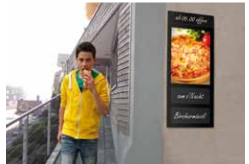
Kundenstopper Boulanger Wandmontagesystem