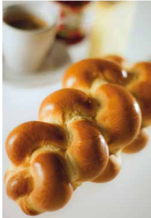
Bildtafeln – auf die Tageszeit abgestimmte Werbung